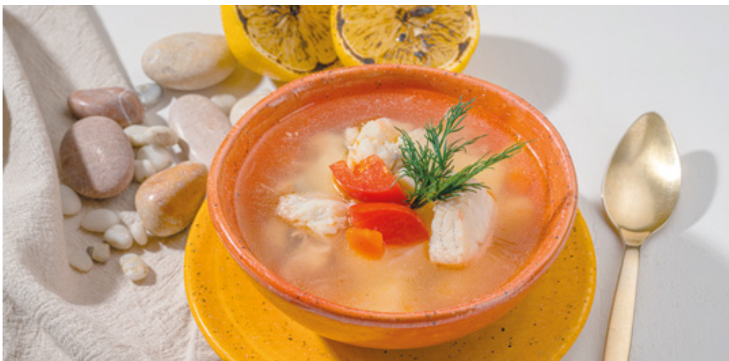
Волжская уха 350г 390.-

на основе куриного бульона, желтков и имеретинского шафрана 350г