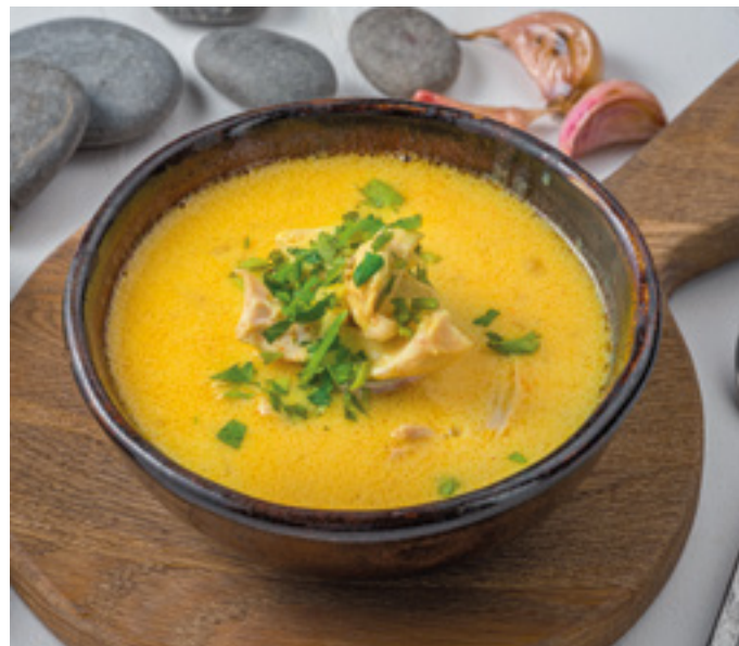
Домашний грузинский суп 290.-

домашняя лапша с тушёными овощами и грузинскими пряностями 400г