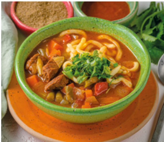
Лагман с говядиной 390.-

домашняя лапша с тушёными овощами и грузинскими пряностями 400г